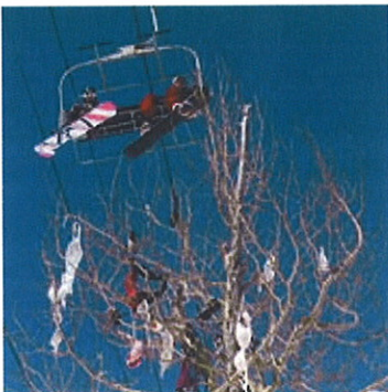
Unkonventioneller Baumschmuck: BHs an den Bäumen - und das im so strengen Utah

Die zieht es immer öfter talabwärts in Utahs jüngstes Skigebiet, "The Canyons". Dieses müssen sie sich allerdings mit Elchen teilen, die schon mal stur eine der 155 Pisten blockieren. "Deshalb haben wir extra eine "Elch-Patrol" eingeführt", erzählt Jonathan Bebe von der Bergwacht. Die Elche seien mittlerweile eine Attraktion: Gerade Europäer schätzten diesen Hauch von Wildnis, meint Bebe schmunzelnd.